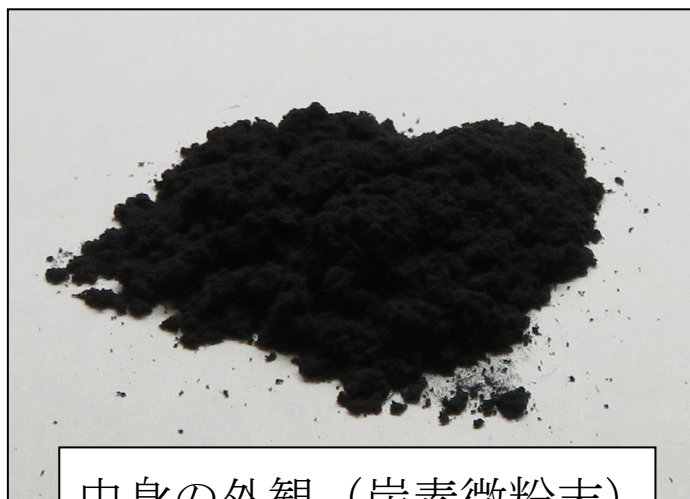
中身の外観（炭素微粉末）

中身は、純粋な炭素微粉末であり、発火性、引火性、爆発性、 毒性などはありません。中身を開けますと、少しの風でも周 囲に飛散しますので、注意してください。