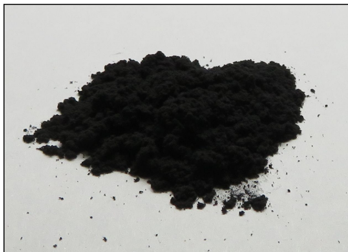
Appearance of the contents

The contents are pure fine carbon powder, and it's not ignition, not catch fire, not explosion, no reaction with water, as shown in MSDS( Material Safety Data Sheet) . If the contents are opened, it scatter on here and there. Handle with care !